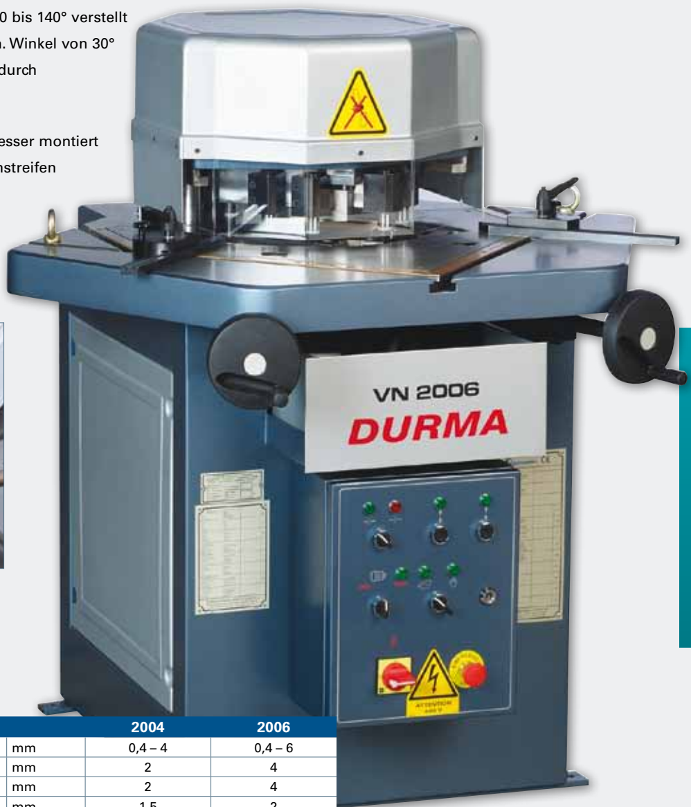
VN 2006 mit verstellbarem Schnittwinkel

VN 2006 mit 2 präzisen einstellbaren Winkelanschlägen.