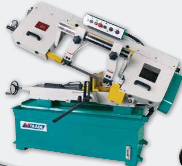
BMT 250 V mit stufenlos regelbare Bandgeschwindigkeit