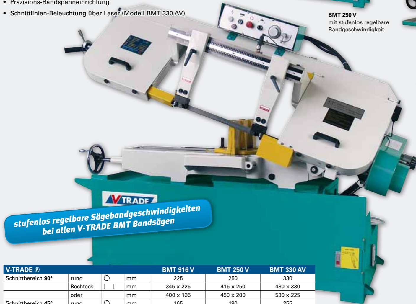
BMT 330 AV mit Schnitlinien- Beleuchtung über Laser

stufenlos regelbare Sägebandgeschwindigkeiten bei allen V-TRADE BMT Bandsägen